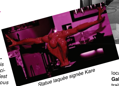
Statue laquée signée Kare